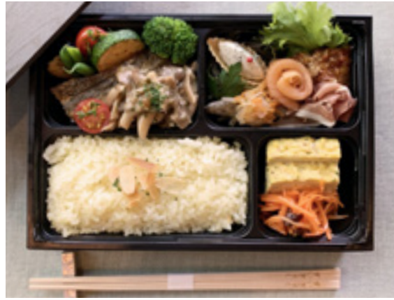
メインがお魚のランチボックス ¥3,000(税込)

[ 内容例 ] その日の市場から、鮮魚のポワレアンチョビ風味きのこソースと季節野菜 / 気まぐれオードブル・スパニッシュオムレツ・キャロラペ / スパイシーバターライス添え