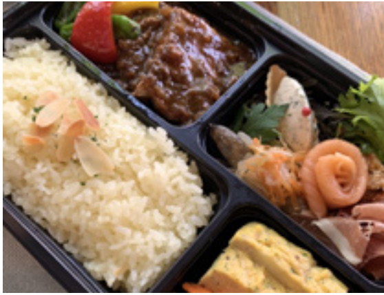
メインがお肉のランチボックス ¥3,000(税込)

[ 内容例 ] 仙台ハーブ豚ばら肉の柔らか煮込みと温野菜 / 気まぐれオードブル・スパニッシュオムレツ・キャロラペ / スパイシーバターライス添え