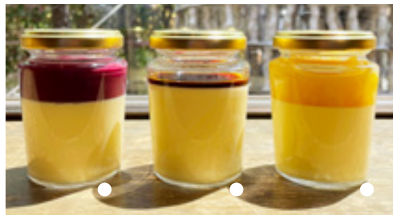
すいぎょく特製爽やかプリン

●プレートサイズ 径21cm(カレールー別盛) ●お受け取り時間 11:30~14:00